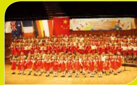
預備R、預備S、初一C、初一G、初一O