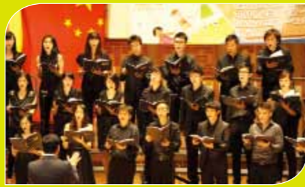
嘉賓：舊生會合唱團