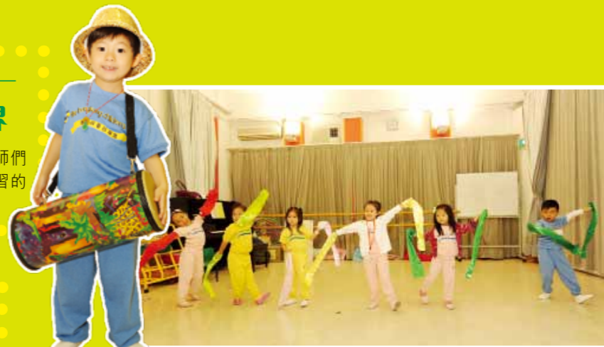
非洲音樂 — 節奏動感《Che Che Kule》

為了讓兒童認識各地的音樂，導師們專誠搜集了世界各地適合兒童學習的音樂活動及教具學具。