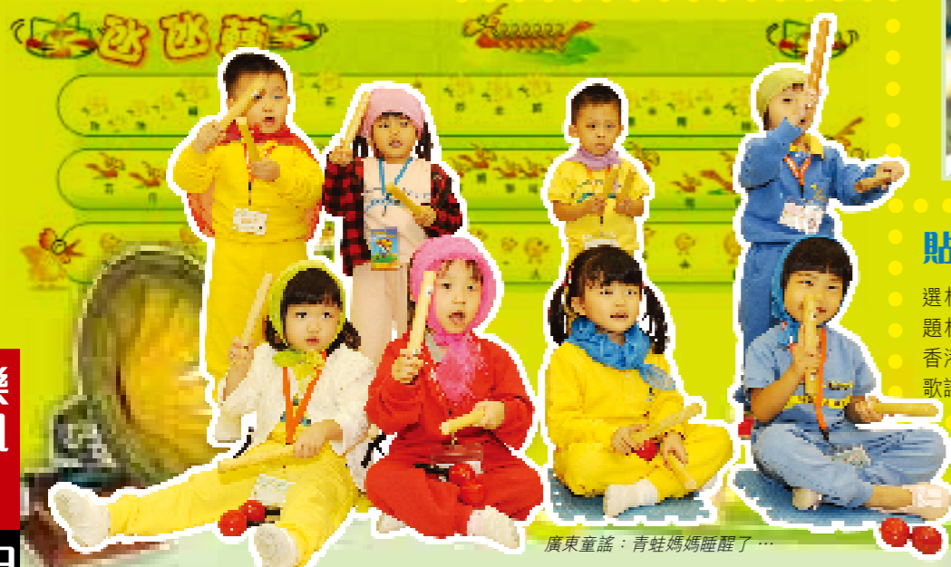
廣東童謠：青蛙媽媽睡醒了...

選材方面，除了「以兒童為中心」，題材貼近生活、富童趣外，更考慮了香港獨特的「兩文三語」文化，中外歌謠一應俱備。