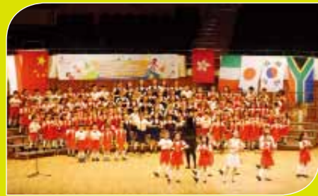
預備F、初一F、初一J、中二C