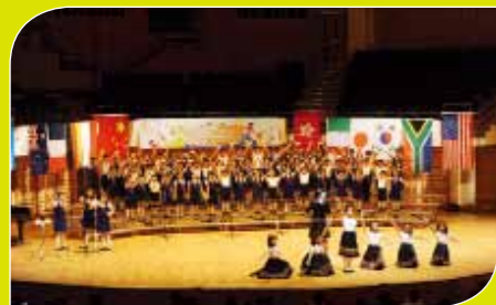
中一B、中二B、手鈴小組