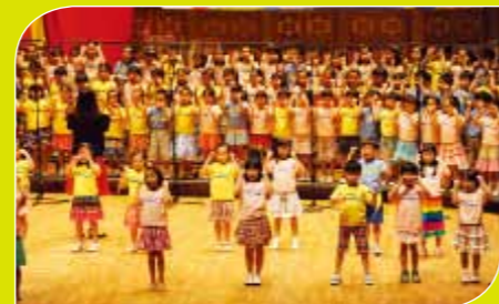
初一B、初一F、初一R、初二F