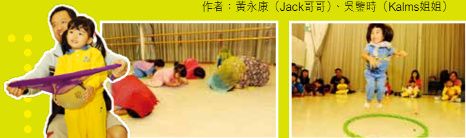
透過全身的活動讓幼兒用身體感受音樂

針對幼兒學習的黃金期，我們透過多元化及多感官學習 (Multi-sensory)，啟發幼兒的音樂能力、創造力及其他多元智能等。